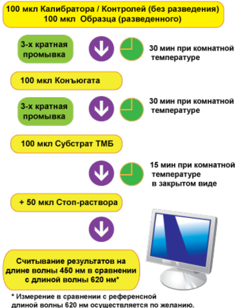
СХЕМА ПРОВЕДЕНИЯ АНАЛИЗА: AI-LINE ELISA