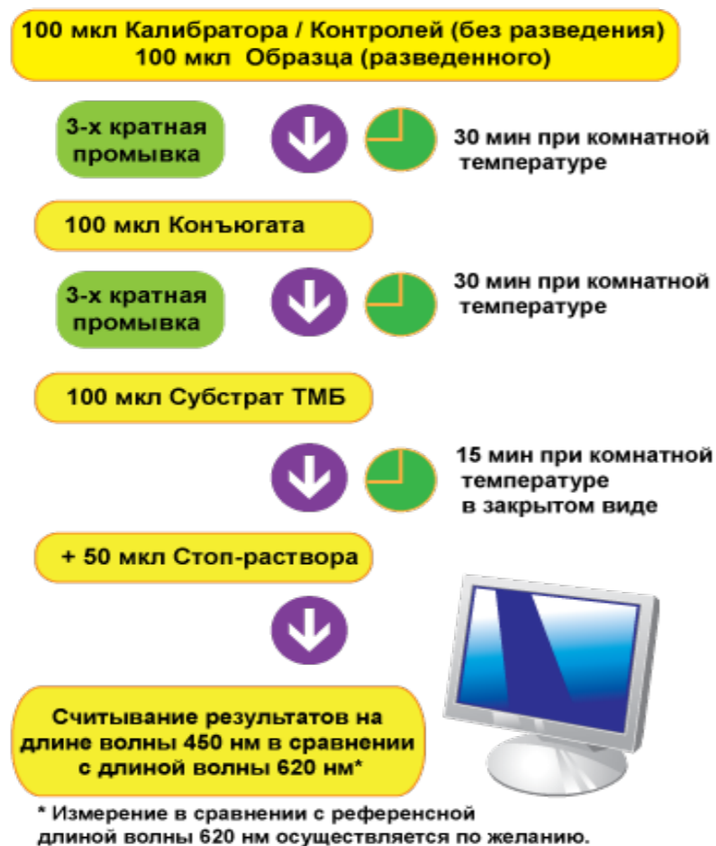
СХЕМА ПРОВЕДЕНИЯ АНАЛИЗА: AI-LINE ELISA